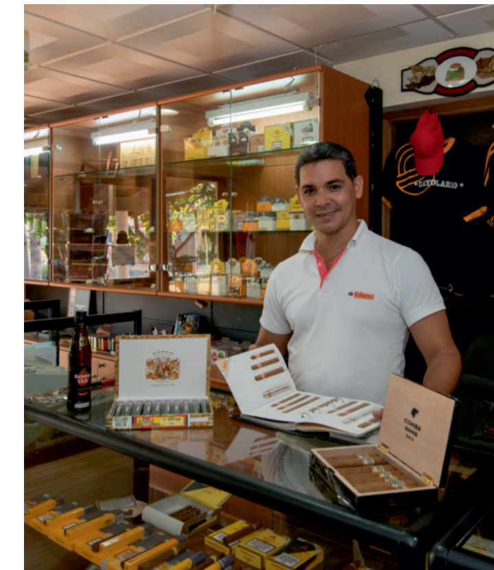
CASA DEL HABANO

Tienda Bella Isla Resort**** Tel.: (+53) 45-248-121